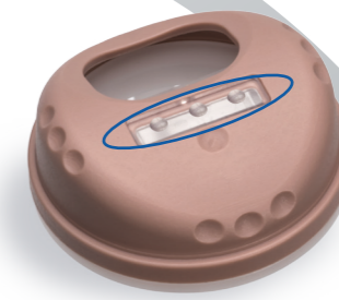
Starkt membran 3 punkter