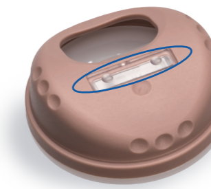
Medium membran 2 punkter